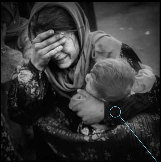
Autor: Mario Pereda Berga

“As veces hai unha imaxe única, cúa composición posúe tal vigor e riqueza, e cun contido que expresa tanto, que só esa imaxe xa é unha historia completa en si mesma. Pero isto acontece poucas veces. Os elementos que conxuntamente poden facer brillar un suxeito xeralmente están dispersos - xa sexa en términos de espazo ou de tempo. Pero cando se logra fotografar tanto a medula como o fulgor do suxeito, isto é o que se chamaría un relato fotográfico. E é a páxina a que se encarga de reunir os elementos complementarios que están dispersos nas distintas imaxes”