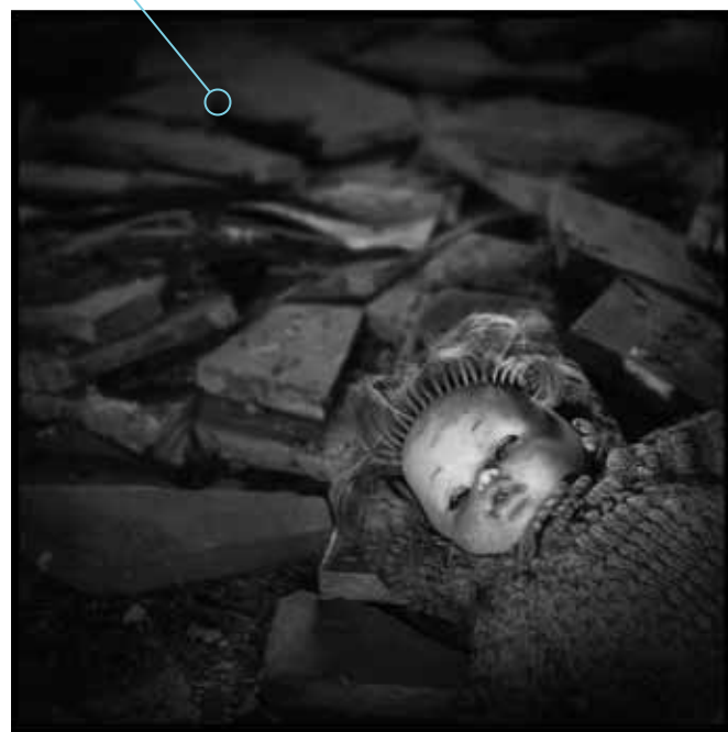
Autor: Mario Pereda Berga

Unha secuencia de imaxes orientadas a contar unha historia