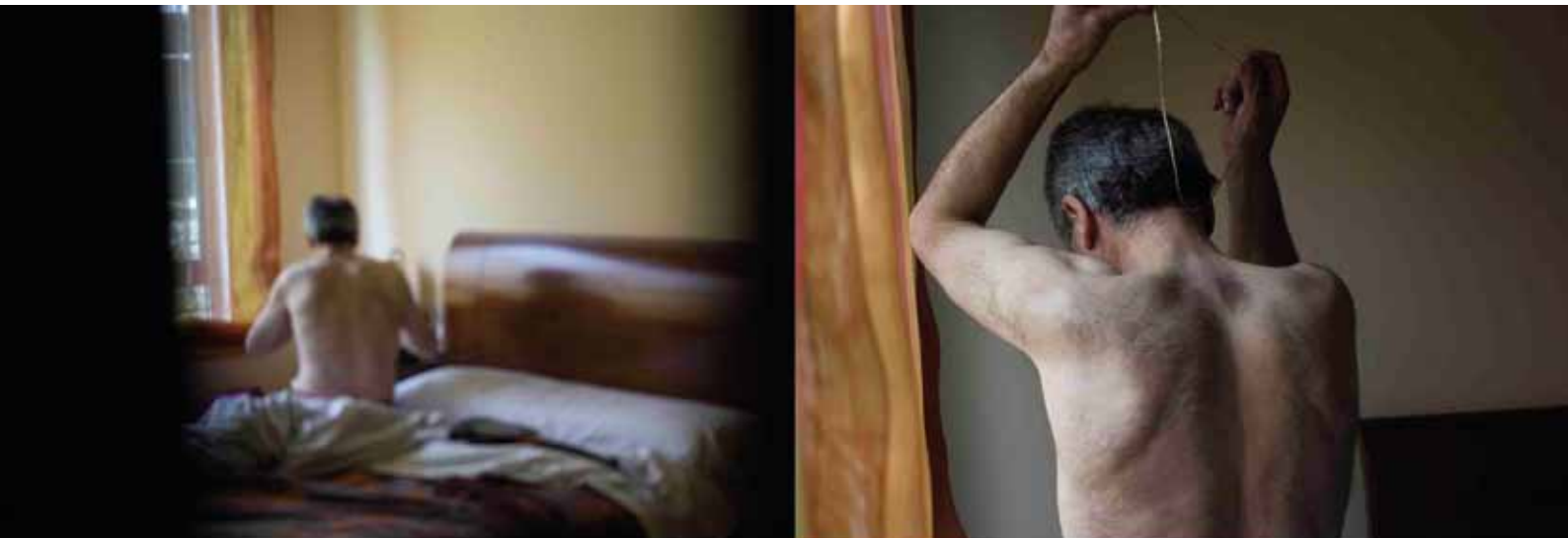
Autor: Miriam Méndez Castro

É aínda un concurso novo, pero podemos dicir que naceu con moita forza, na súa primeira edición foron mais de cincuenta autores de toda España, os que participaron cos seus traballos, e nesta segunda edición superaron esa cifra chegando os setenta e gañando ademais un carácter internacional coa participación de autores portugueses.