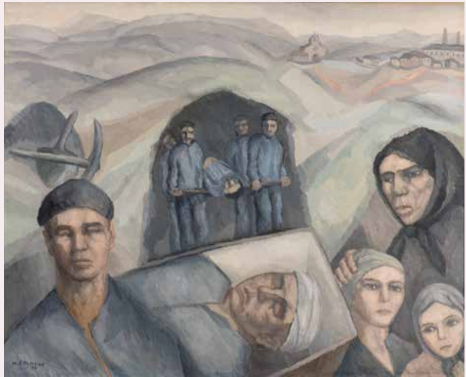
Mineiros Óleo/lenzo 98 x 121 cm 1929