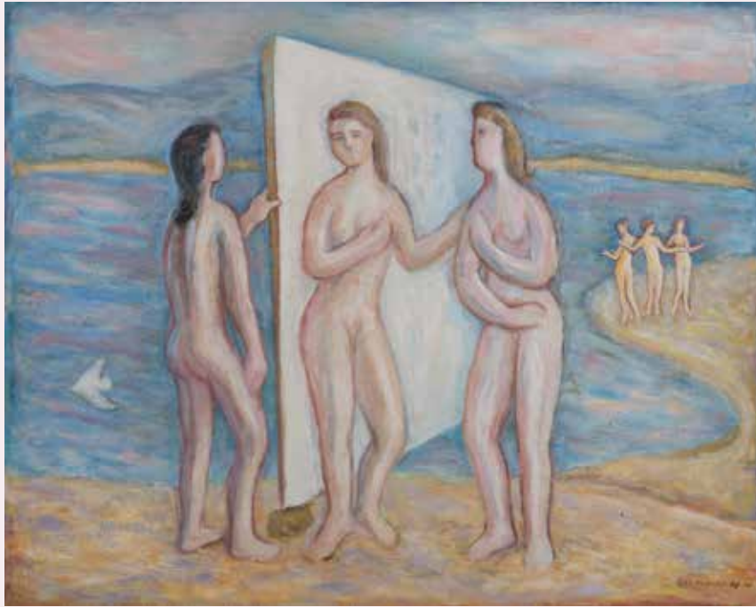
Tres Grazas Óleo/lenzo 65 x 81 cm 1968 - 1970