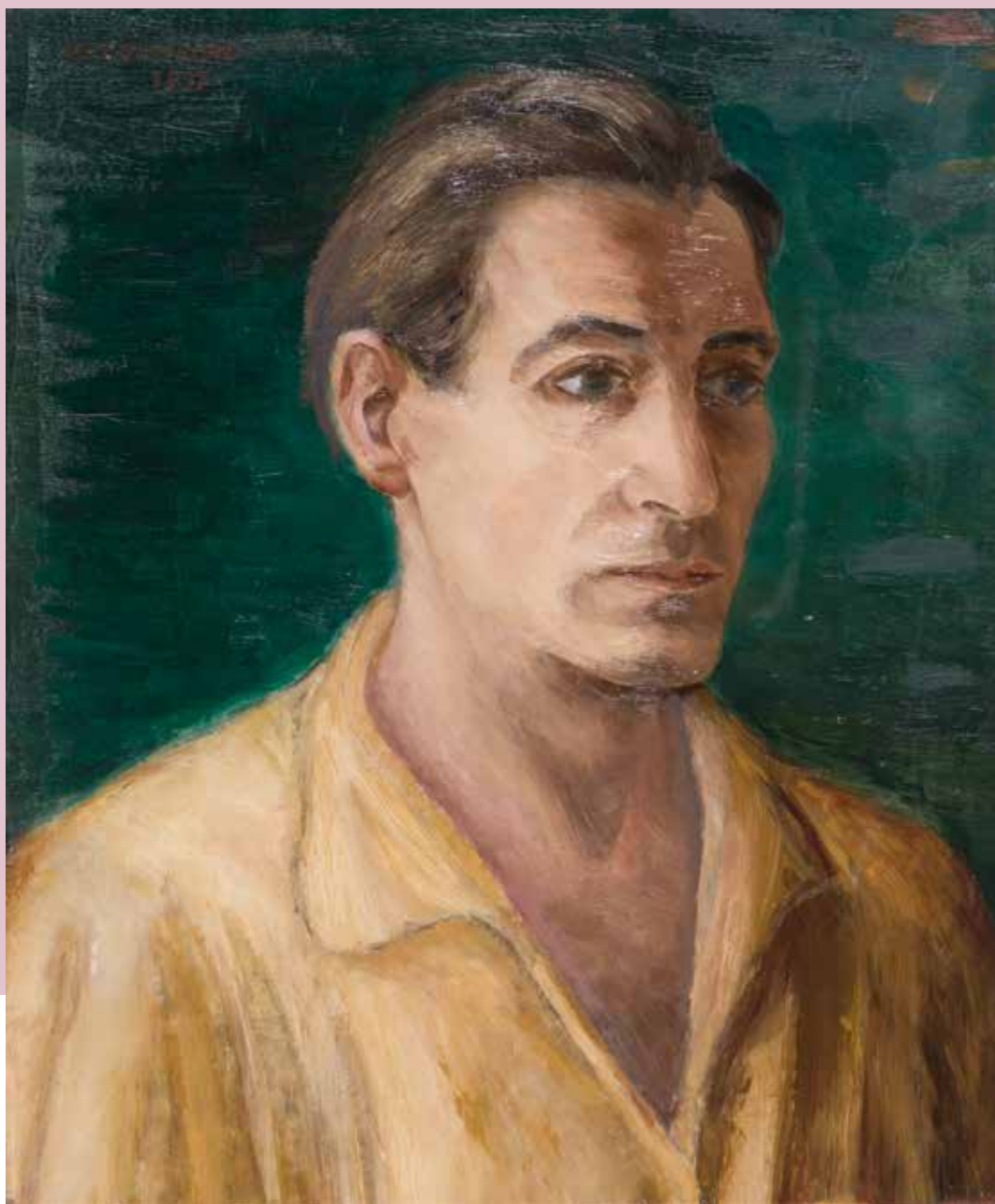
Autorretrato Óleo/lenzo 46 x 38 cm 1937