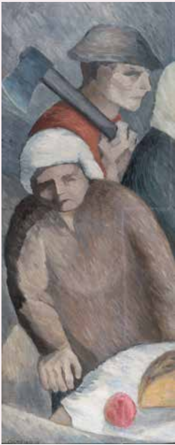
Campeños Óleo/lenzo 119 x 48 cm 1928