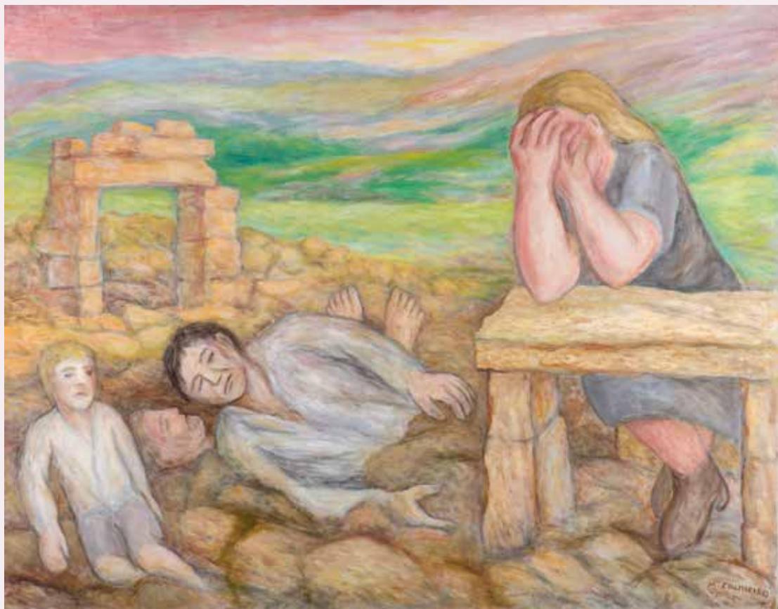
Sen título Serie "A guerra" Tinta/papel 25 x 32,7 cm Ca. 1937