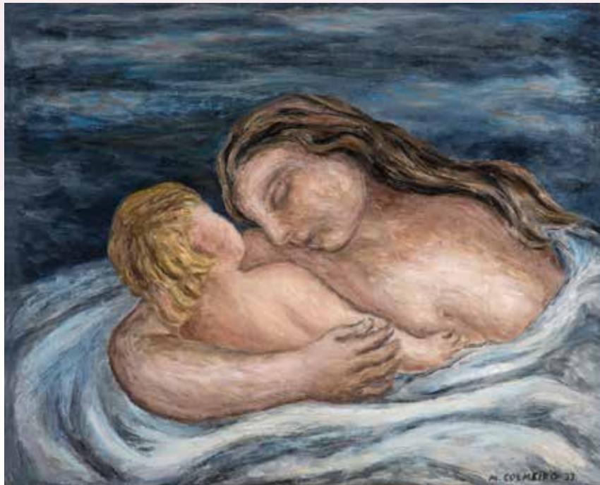
O sono Óleo/lenzo 66 x 82 cm 1933