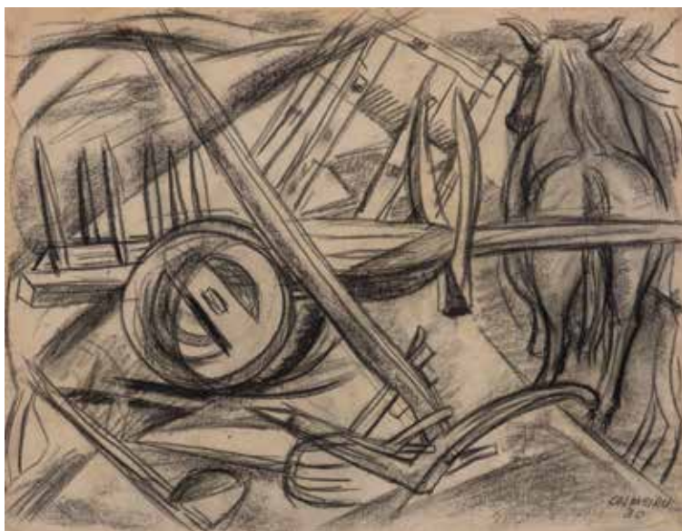
Sen título Lapis/papel 29 x 37,7 cm 1930

Serie "A guerra" Tinta/papel 32 x 40 cm 1936