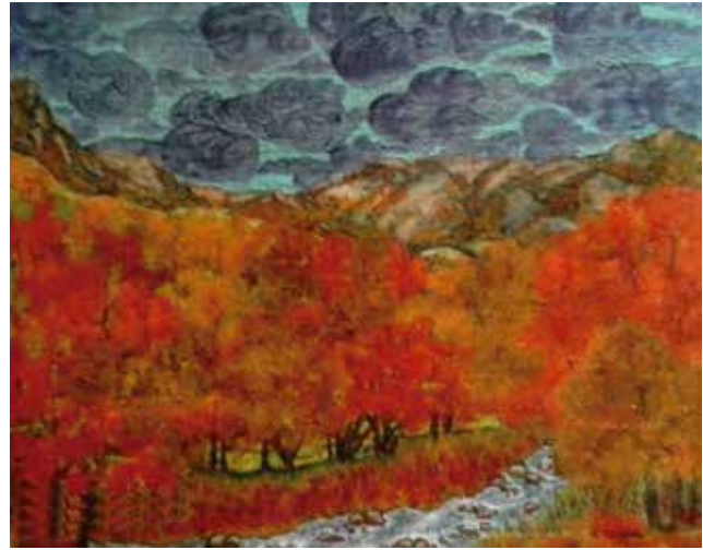
OUTONO - 1

Acrílico e outros sobre lenzo 150x110 2015