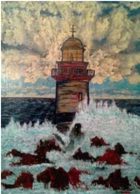
FARO Acrílico e outros sobre lenzo 100x73 2000