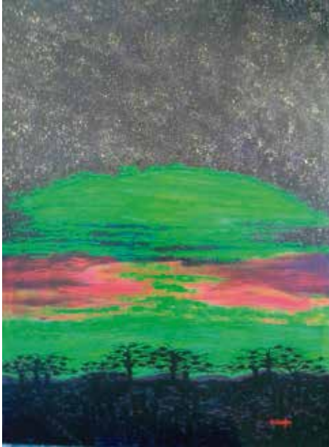
AURORA BOREAL - 3 Acrílico e outros sobre lenzo 150x110 2013