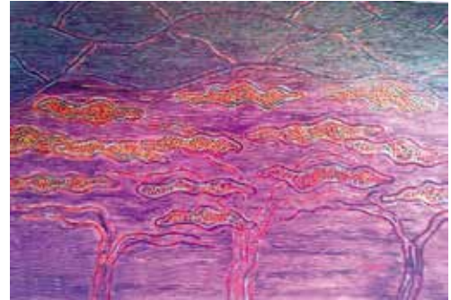
O BOSQUE Acrílico e outros sobre lenzo 130X200 2010