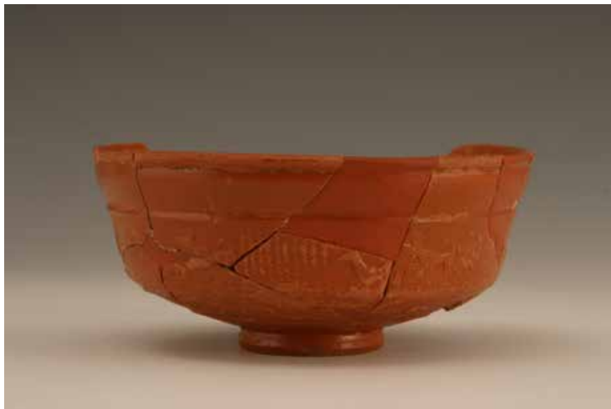
Cunca da “terra sigillata”

Indicouselles ó principio que, á marxe de ánforas con novos tipos de produtos, algo que se fixo habitual desde a “conquista romana” foi a adopción dos seus gustos e costumes (incluída a propia lingua, o latín).