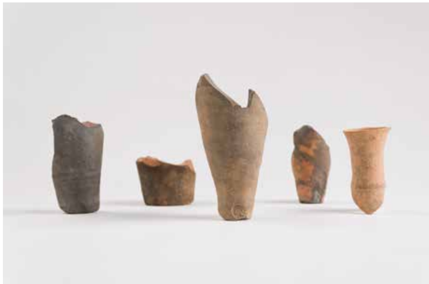
Alg6ns dos ung6entarios bizantinos descubertos en Vigo 6 Museo Municipal Qui6ones de Le6n

Ata aqu6 chegan 6nforas cargadas con alimentos, adornos, ung6entarios, vaixelas finas e com6ns desde diferentes puntos do Mediterr6neo oriental, especialmente de onde hoxe atopamos Turqu6a, Siria e Palestina (n625-27).