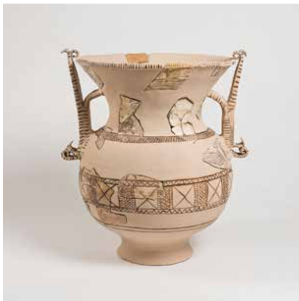
Crátera da villae romana de Toralla

As ánforas empregadas trátanse de tipos exclusivos da Rías Baixas: as ánforas tipo “San Martiño de Bueu”. O seu nome provén da súa identificación no xacemento epónimo do centro urbano de Bueu. Diferenciamos dous tipoloxías: a máis pequena parece que contería salsas, mentres que a máis grande sería a que sería utilizada no transporte do peixe, como se pode observar na reprodución sita na sala (nº14).