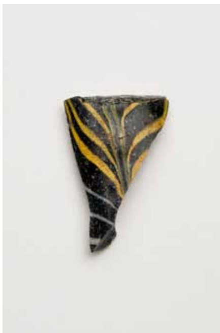
Fragmento de aryballos púnico de pasta vítrea

O metal intercambiado polos galaicos podía ser achegado en “bruto” ou en forma de pezas xa acabadas. Un exemplo totalmente característico de peza finalizada é a chamada machada de tope (nº1) , con ou sen argolas. As Rías Baixas concentran a maior cantidade de machadas deste tipo coñecidas na actualidade, as cales adoitan aparecer en depósitos ou acubillos con decenas de exemplares. Se vos fixades ben, obsérvase como estas pezas, procedentes dun xacemento próximo ó museo, aínda conservan as rebabas do molde e o cono de fundición. Isto indícanos que foron fundidas, pero que se ocultaron sen terminar.