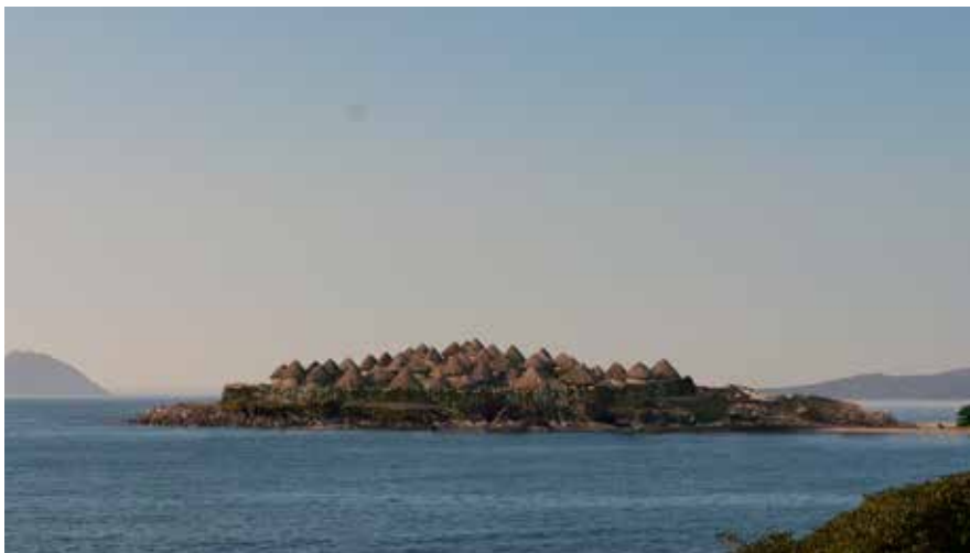
Reconstrución virtual do castro de illa de Toralla

Ata o momento falouse de comercio, pero aínda non se dixo con que se comerciaba na época. Á marxe de materiais perecedoiros (alimentos, madeiras, etc...) ou escravos, a principal achega ás “transaccións comerciais” dos galaicos era o metal (ouro, prata, estaño e bronce). Pola súa banda, os comerciantes púnicos comerciaban con alimentos contidos en ánforas como viño, aceite e conservas de peixe; adornos de pasta vítrea (colares e pulseiras) e perfumes contidos en recipientes de vidro (ungüentarios ou aryballos ) ( nº5 ).