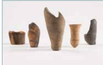
Ungüentarios orientais. Os únicos na área atlántica.