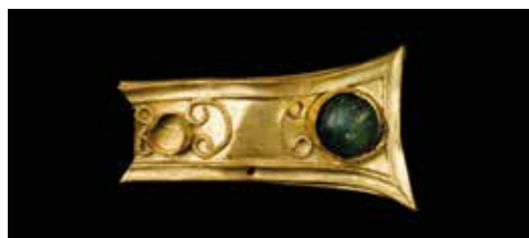
AS CRENZAS VIAXAN COS OBXECTOS E COAS PERSOAS O cristianismo S. IV-VII d. C. Obxectos decorados con motivos cristiáns. Unha cruz visigoda en Vigo. A basílica do Areal.