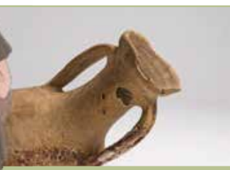
As ánforas. A Haltern 70, a maior concentración do Imperio.