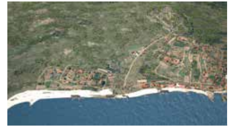
AUDIOVISUAL Do Século I ao VII d.C.

VIGO, PORTO DO MUNDO Tardoantigüidade S. V-VI-VII d. C. Relacións con África, co resto da península, co atlántico norte e con Oriente.