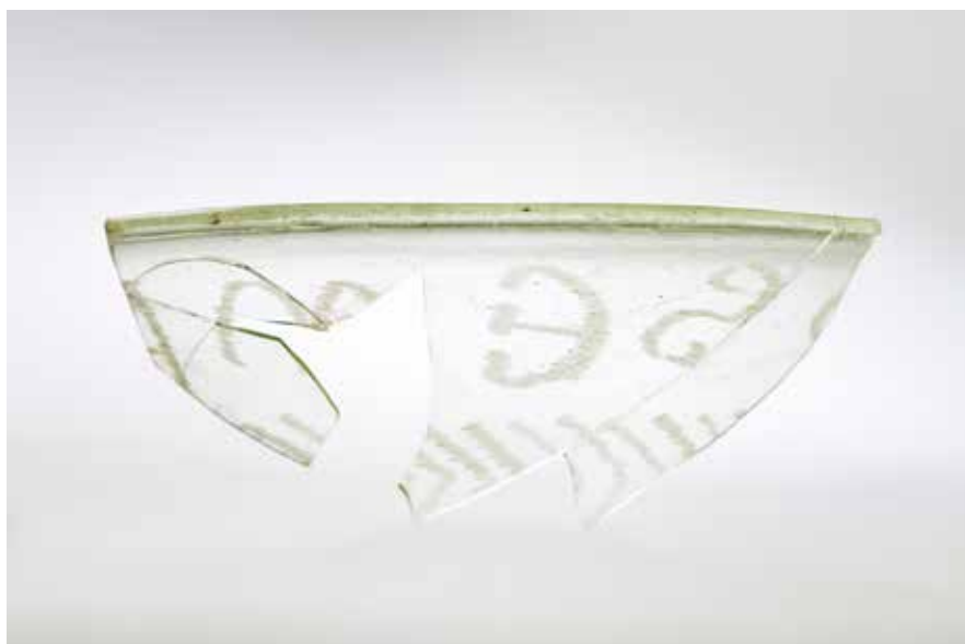
Fragmento de cunca coa inscrición “Semper vivas”

A partir do s. III d. C. o Imperio romano caracterizouse por unha forte desestabilización política, onde os emperadores eran constantemente depostos polas boas ou polas malas. As continuas