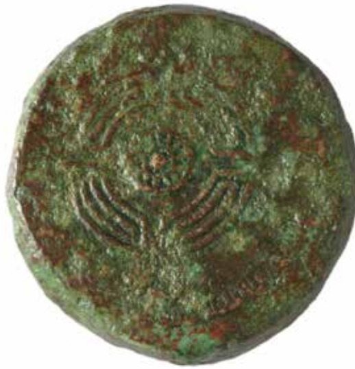
Reverso de moeda de "caetra"

Reciben o seu nome polos selos ( sigillum ) que mostran nas súas paredes. A diferenza das que se observaron na primeira vitrina de materiais romanos, estas xa son ou ben producións de obradoiros hispánicos ou gálicos.