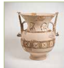
A crátera pintada da villa de Toralla. Unha peza singular que, por primeira vez, se mostra reconstruída.