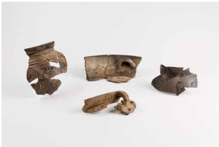
Cerámicas castrexas procedentes de castros de Vigo

Ao marxe dos seus produtos comerciais, a presenza púnica en Vigo están perfectamente testemuñada grazas á presenza destas pezas. Trátase de dúas simples pedras alongadas de granito, pero a pesar da súa aparente simplicidade, atópanse diante dun altar de orixe púnico (nº4) .