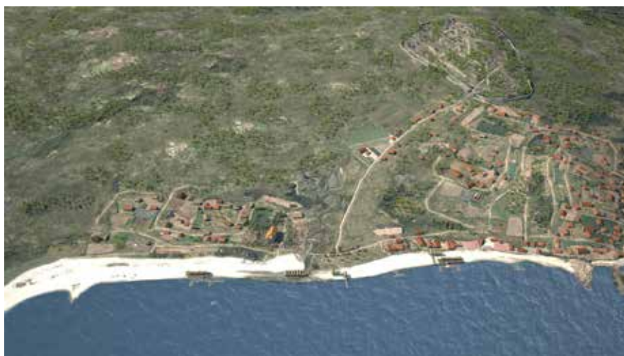
Reconstrución virtual do Vigo no s. VI d. C ©Museo Municipal Quiñones de León (Alicia Colmenero/Magoga Piñas)

Nesta etapa final do mundo romano xa estaban plenamente instalados os ritos cristiáns de inhumación, ó contrario das épocas precedentes, onde se procedía á incineración. O uso das ánforas para esta función radica na facilidade de acceso a este tipo de recipientes baleiros e, sobre todo, ás altas taxas de mortalidade infantil da época. A pesar de que unha boa parte do comercio do Vigo tardorromano facíase con rexións do Mediterráneo oriental, tamén existía outro importante foco de atracción mercantil no norte de Europa. Por exemplo, da costa do mar Báltico proceden estes colares realizados en ámbar (resina fósil), os cales formaban parte dos enxovais funerarios desta época. Da zona aquitana de Francia (rexión de Burdeos) proceden cerámicas comúns e de mesa.