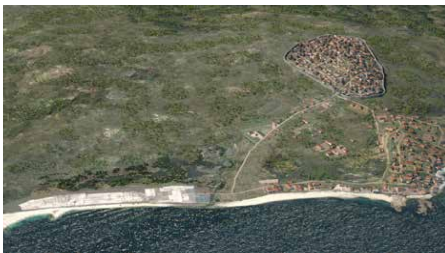
Reconstrución virtual do Vigo do s. III d. C.

Esta peza foi realizada nun taller da Galia e procede do castro de Castromao (Ourense). Perciben algo estraño nela? Presenta unha serie de inclusións metálicas, os restos de remaches que foron utilizados na súa reparación. A falta de adhesivo, e sendo este tipo de pezas de tan alto valor, procedeuse a súa "restauración" con grampas metálicas.