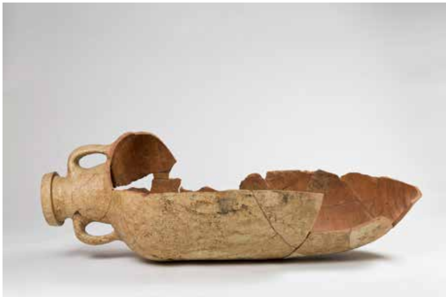
Ánfora empregada como enterramento infantil

Outro exemplo de produto de “luxo” é o vidro ( nº21 ), que podía aparecer en diferentes formas, ben como recipientes (botes, botellas, pequenos pratos e cuncas), ben como adornos. A maior parte do vidro era importado desde outros obradoiros peninsulares, pero a partir da fase final do Imperio romano, constátase a súa fabricación en varios obradoiros locais. Entre as pezas aquí expostas destaca un fragmento de cunca en forma de campá con decoración por abrasión onde observamos motivos en forma de pequenos círculos, espiña de peixe e unha inscrición que representa a expresión “SEMPER VIVAS” (Que vivas sempre).