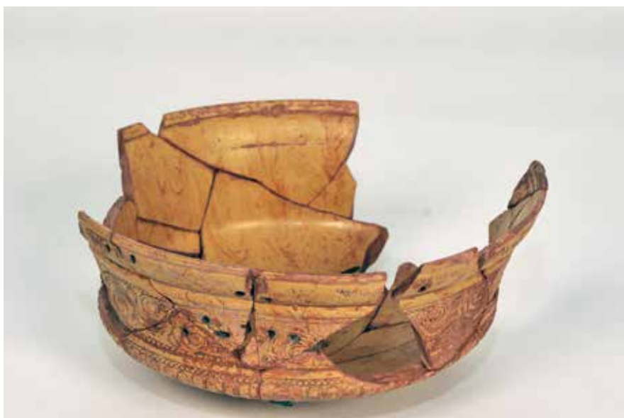
Cerámica marmorata

Un exemplo arqueolóxico deste cambio nos costumes é a utilización das “terras sigillatas” (nº13) como vaixelas de prestixio de consumo de alimentos, é dicir, a cerámica de Sargadelos da época. Todos coñecen o proceso de fabricación dun recipiente de cerámica, non? Pois este tipo de pezas son o primeiro exemplo de produción en serie, porque non se realizaban a torno senón en moldes.