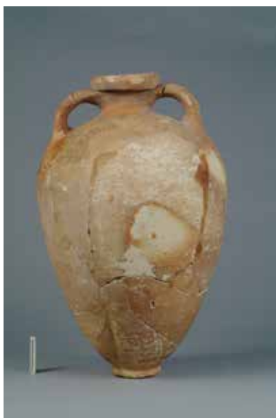
Ánfora San Martiño de Bueu

Na zona baixa da cidade existen dúas realidades moi diferenciadas. Cara ao Norte, hai unha salina na que se obtiña sal mediante a evaporación de auga mariña. Esta estendíase aproximadamente desde a actual Alameda ata a estación de tren de Guixar. Hai que ter en conta que o sal era un ben moi prezado na antigüidade. De feito, denominábanlo o “ouro branco”. Sirva de exemplo palabras como “soldo” ou “salario” que proveñen do pago dun traballo con sal.