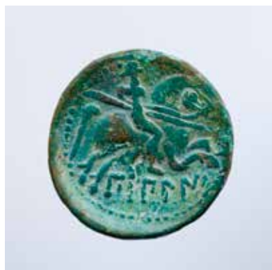
Reverso de moeda celtíbera da cidade de Bilbilis

A pesar desta circunstancia, o comercio púnico aínda estaría presente. Boa proba diso é a presenza de ánforas T7. Máis adiante fálase en profundidade sobre ánforas e terras sigillatas, pero agora destacaremos outra gran innovación introducida polos romanos: a moeda ( nº7 ).