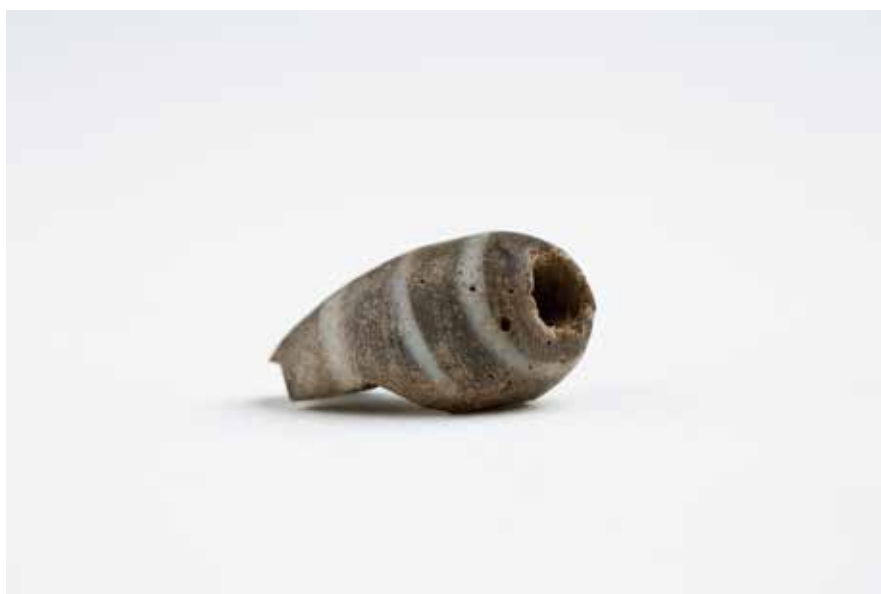
Conta de pasta vítrea de orixe micénica

Durante a fase final da chamada Idade do Bronce e, sobre todo, durante o desenvolvemento da “Cultura Castrexa” existen probas tanxibles destes contactos. A presenza de embarcacións de tipoloxía mediterránea nos petróglifos son boa proba diso ( nº3 ). Na exposición contase tamén cunha peza que, aínda que poida parecer pequena e insignificante, ten un altísimo valor histórico: trátase dunha doa de colar ou pulseira de pasta feita de pasta de vidro de tipoloxía micénica (cultura exea, precursora da civilización grega antiga) ( nº5 ).