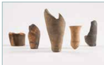
Ungüentarios orientais. Os únicos na área atlántica.