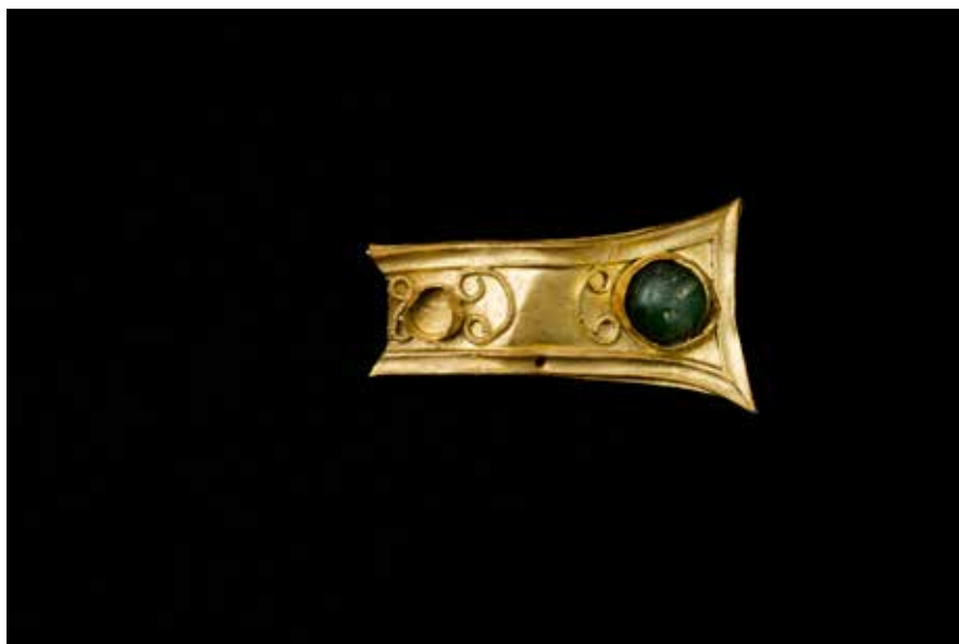
Brazo de cruz de ouro procedente da igrexa prerrománica do Areal de Vigo

cronoloxías, pero o que si observamos claramente é a mencionada inclusión do novo ritual funerario da inhumación. Así mesmo, os produtos de luxo de gusto clásico van sendo substituídos por outra estética máis acorde coa relixión cristiá.