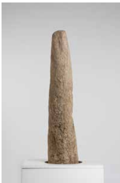
Betilo de orixe púnico do castro da illa de Toralla

A esta rechamante circunstancia hai que engadirille outra igual ou máis curiosa aínda. Este tipo de ferramentas están elaboradas en bronce, aliaxe de cobre e estaño, pero cara ó final da Idade do Bronce, e durante a primeira parte do mundo galaico, engádeselle un terceiro metal: o chumbo. Consecuencia disto, a presenza de chumbo fainas inútiles (moi maleables) como ferramentas.