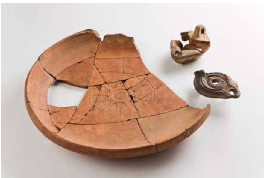
Lucernas e cerámica fina de mesa de imitación