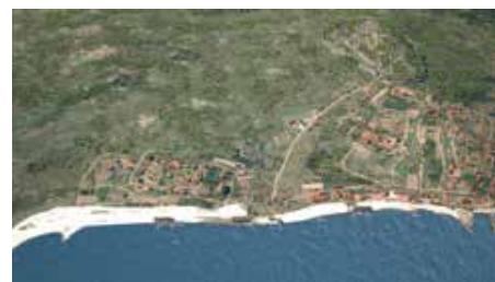
AUDIOVISUAL Do Século I ao VII d.C.

VIGO, PORTO DO MUNDO Tardoantigüidade S. V-VI-VII d. C. Relacións con África, co resto da península, co atlántico norte e con Oriente.