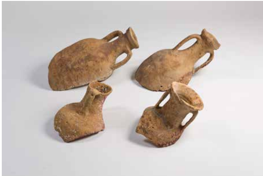
Ánforas procedentes do pecio de Cabo de Mar (Vigo)

Ás súas costas ten lugar unha proxección onde poden observar algunhas das principais rutas comerciais durante época prerromana e unha reconstrución virtual de como serían os castros de Vigo e Toralla. A medida que vaian pasando fíxense no interior desas xanelas. Adiviñan de que se trata? Un pecio, un barco afundido e cheo de ánforas! Pois este barco afundido ten moito que ver co que se atopa nesta parte da exposición: ánforas (nº8-12) .