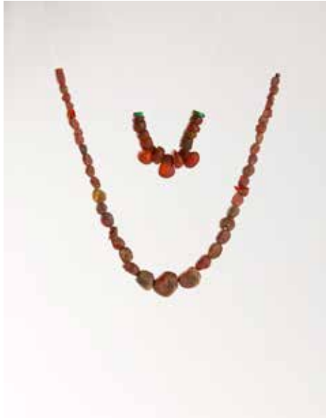
Colares de 6mbar procedentes do norte de Europa 6 Museo Municipal Qui6ones de Le6n (Nando Iglesias)

A partir do s. V d. C., c6o Imperio romano de Occidente practicamente desarticulado politicamente, sendo deposto o 6ltimo emperador no ano 472, o porto de Vigo conv6rtese no 6nico punto da fachada atl6ntica da Pen6nsula Ib6rica que mant6n un flu6ido e importante comercio c6o Mediterr6neo e, m6is concretamente, c6o Imperio bizantino.