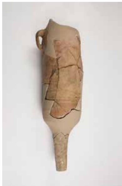
Ánfora T7 de orixe púnica

Estes primeiros contactos entre as poboacións dos castros e os romanos foron ao longo do s. I a. C, é dicir, hai algo máis de 2000 anos, coa súa efectiva inclusión no Imperio romano ao final das Guerras Cántabras, cara ao 19 a. C. Neste contexto, e no plano comercial, os primeiros produtos de orixe romana foron esencialmente ánforas con alimentos (maioritariamente viño) de orixe italiana e vaixelas finas de mesa (terras sigillatas itálicas e cerámicas campanienses) ( nº7 ).