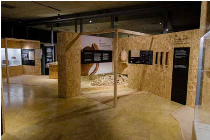
Vista do interior da exposición