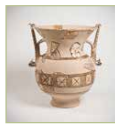
A cratera pintada da villa de Toralla. Unha peza singular que, por primeira vez, se mostra reconstruída.