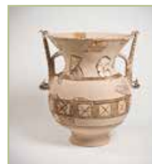
A cráter pintada da villa de Toralla. Unha peza singular que, por primeira vez, se mostra reconstruída.