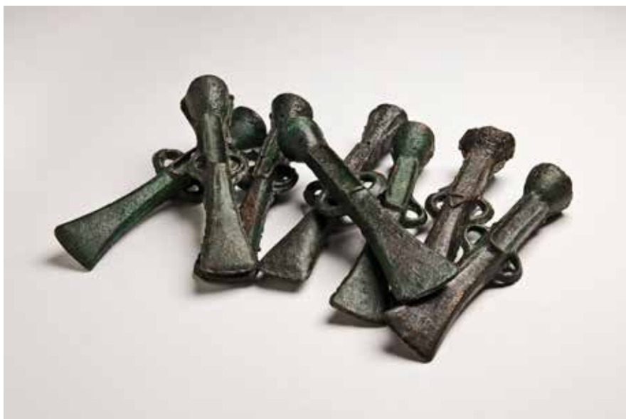
Conxunto de machadas de tope e argolas

A esta rechamante circunstancia hai que engadirille outra igual ou máis curiosa aínda. Este tipo de ferramentas están elaboradas en bronce, aliaxe de cobre e estaño, pero cara ó final da Idade do Bronce, e durante a primeira parte do mundo galaico, engádeselle un terceiro metal: o chumbo. Consecuencia disto, a presenza de chumbo fainas inútiles (moi maleables) como ferramentas.