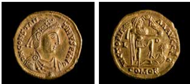
Solidus de Constantino III

Expositor 16: Solidus de ouro do emperador Constantino III, acuñado en Lugdunum (Lyon, La Galia) entre os anos 407 y 408 d. C. Esta moeda acúñase por primeira vez no ano 311 en época de Constantino I e foi moi utilizada polos emperadores usurpadores (emperadores postos e depostos polo exército) como forma para lexitimar a súa posición. A súa emisión continuará ata entrada a Idade Media como moeda para realizar grandes transaccións comerciais.