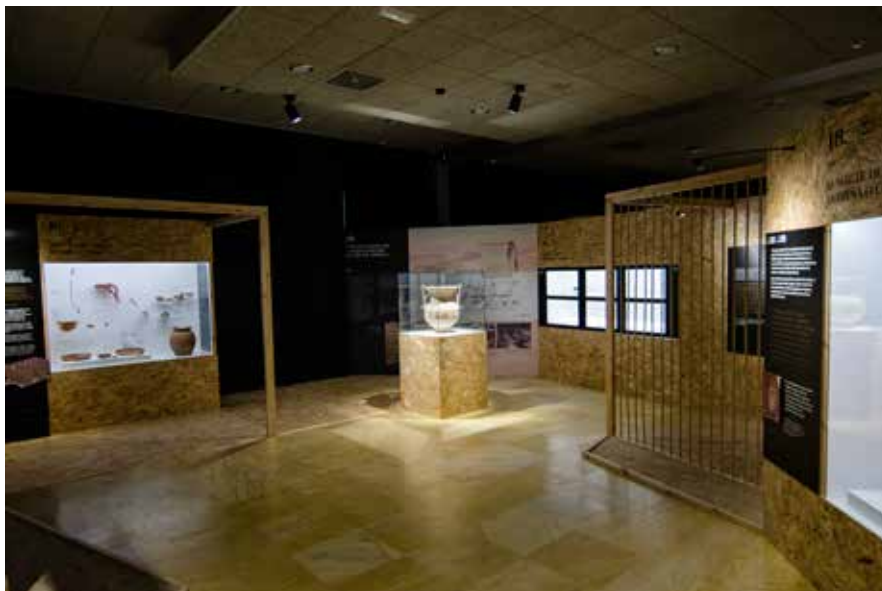
Vista do interior da exposición