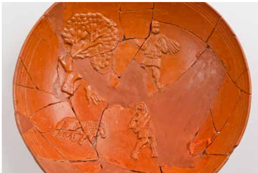
Terra sigillata coa representación do sacrificio de Isaac

Nestas vitrinas ten outros exemplos de elementos con simboloxías cristiás, con representacións de crismóns e cruces. Entre elas tamén cabe destacar pola súa excepcionalidade este cunca de "terra sigillata" africana. Nela recóllese a representación de temática bíblica do sacrificio de Isaac .