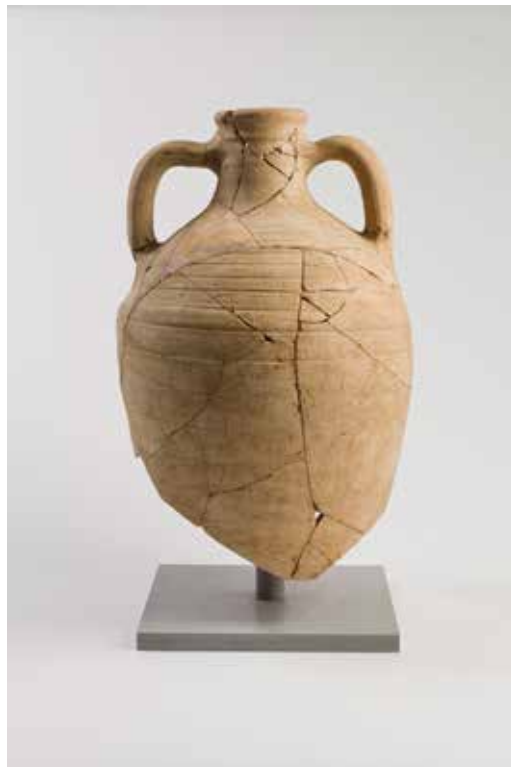
Ánfora tardía do mediterráneo oriental

De novo pódese observar outra panorámica de Vigo de hai 1400 anos, despois da caída do Imperio romano. O Castro está totalmente abandonado e despoboado e o que eran salinas agora mesmo está ocupado por un cemiterio. Se unha vez abandonadas as salinas, a zona foi transformada nun xigantesco camposanto onde se identifican con claridade as estelas dos enterramentos e unha construción singular: unha basílica , A que podería ser a primeira construción cristiá de Vigo.